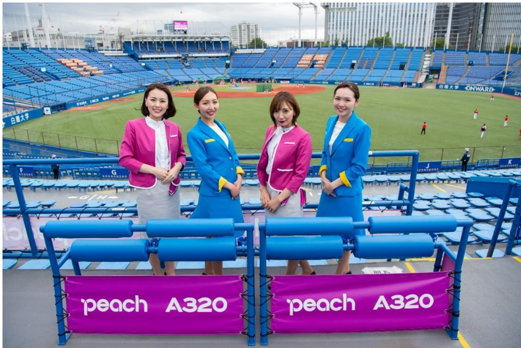
Peach ヒップバーシート

さらにPeachは明治神宮野球場が今年度から導入した「ヒップバーシート」のネーミングライツも獲得しました。見晴らしの良い立見エリア最前列に配置されたシートを「Peachヒップバーシート」と名付け、今シーズン末までコラボレーションします。