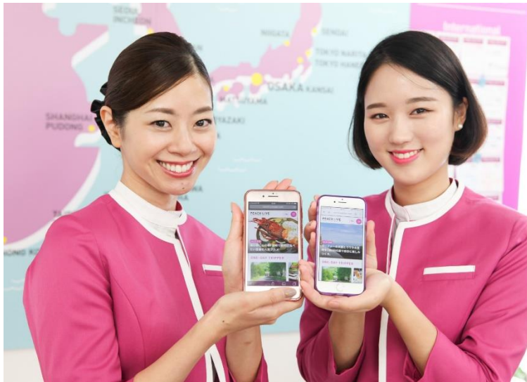
介绍新版 PEACH LIVE WEB 的 Peach 乘务员

Peach Aviation 株式会社(中文名称：乐桃航空·以下简称：Peach) 执行董事 CEO 井上慎一先生今日发表，「PEACH LIVE」杂志的全新网络版本「PEACH LIVE WEB」(peachlive.net)。