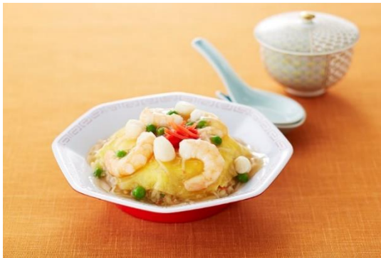
在日本誕生的中華料理

新登場的兩道機內膳食「天津炒飯」及「拿坡里麵」是只有在日本當地才能品嚐到的異國料理；由日本當地的中華餐館及洋食餐廳所自行研發出的口味深受日本民眾的喜愛，成為了家喻戶曉老少咸宜的「庶民美食」，如此美味的佳餚甚至也抓住了海外民眾的味蕾，紛紛前來日本品嚐。好消息！現在起搭乘樂桃航空就能夠在機上享用這兩道美味料理囉！