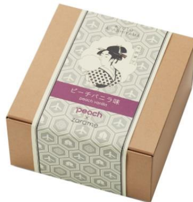
京都嵐山 zarama 棉花糖 桃子香草口味(日幣 400 圓)

不僅如此，樂桃航空這次還與京都知名的咖啡廳 INODA COFFEE 合作，機上推出其原創品牌咖啡，可搭配新推出的「鯖魚三明治」一起享用，就成了經濟實惠又兼具美味的機上輕食。