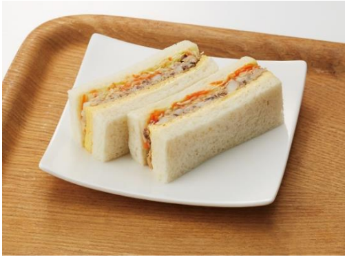
鯖魚三明治(日幣 400 圓)