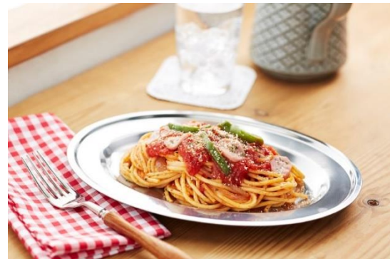
日本經典洋食料理