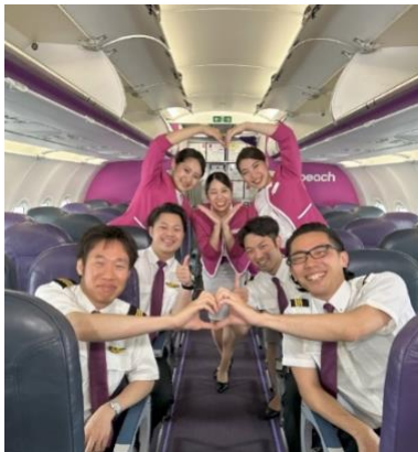
プロモーション映像に出演した Peach 運航乗務員と客室乗務員