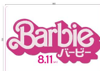
縦 550mm 横 800mm