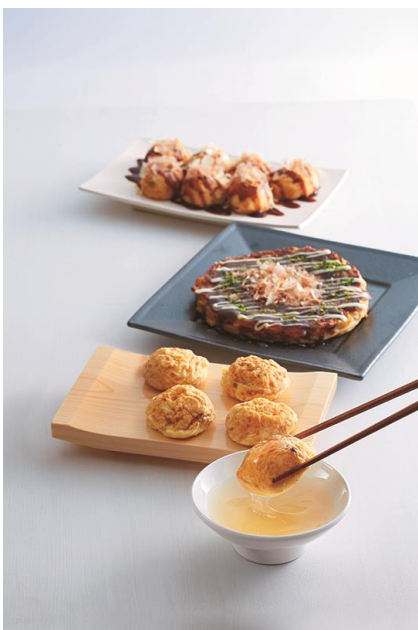
「PEACH DELI」春メニュー ～関西の粉もんグルメ食べつくし～ 上: 「たこ昌」のたこ焼(7個入) 中: 老舗「千房」の鹿児島黒豚モダン焼き 下: 「たこ昌」の明石焼(5個入)

Peach はこれからも、「Peach に乗ったら、必ずあれを食べなくちゃ」と思えるような、Peach でしか味わえない、本格的で美味しいメニューを取り揃えてまいります。どうぞご期待ください。