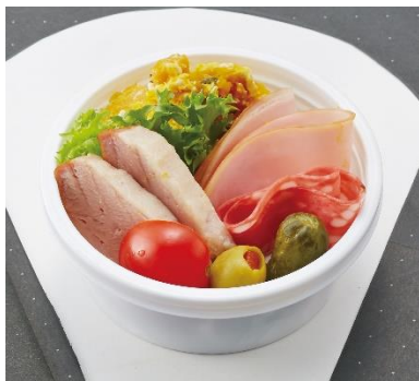
「チョイ食べシリーズ Aセット」(500円)

今回の「Peach Deli」冬メニューでは、ワンコイン(500円)で小腹を満たせる「チョイ食べシリーズ」が新登場*1します。鴨の燻製、ハム、パンプキンサラダが入ったAセットと、チキンの唐揚げとポテトサラダがコンビになったBセットの2種類からお選びいただけます。