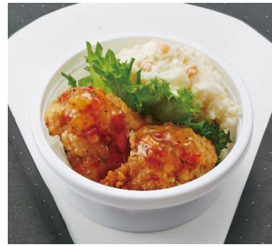
「チョイ食べシリーズ Bセット」(500円)

また、冬のあったかメニューとして、「白身魚フライとチーズのカレー(800円)」、「炭焼きチキンとたっぷりきのこのカルボナーラ(800円)」、「ボルシチ(500円)」、「にゅうめん 梅と豚肉(500円)」の4つが新たにラインアップに加わりました。