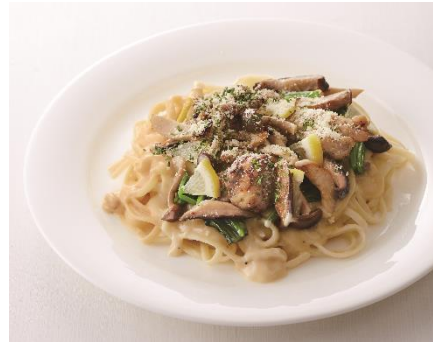
「炭焼きチキンとたっぷりきのこのカルボナーラ」(800円)